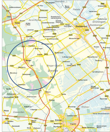
Plattegrond Gemeente Borger-Odoorn